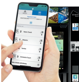
Maestro Touch est compatible avec l'appli de sélection et de paiement digital Breasy