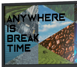
Design moderne et attractif