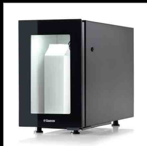
Mini frigo FR7L